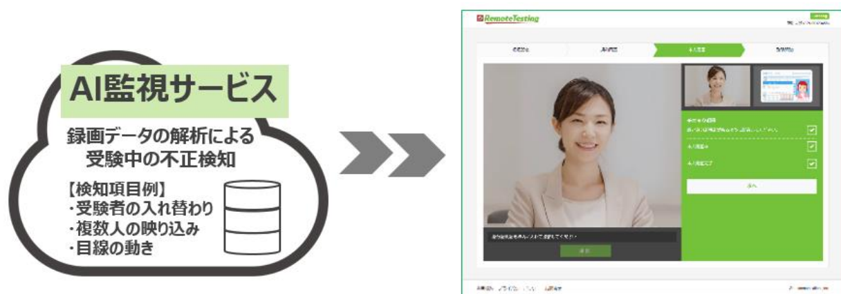
※画面はイメージです

※IP テスト (オンライン): 企業・学校などの団体が任意に日時を設定し、インターネット上で受験いただく制度