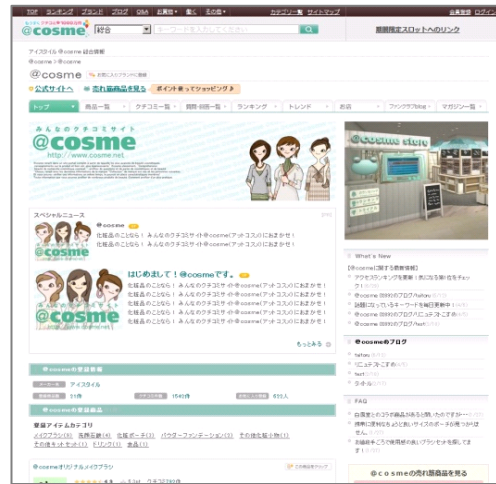
◆ ブランドファンクラブ導入後