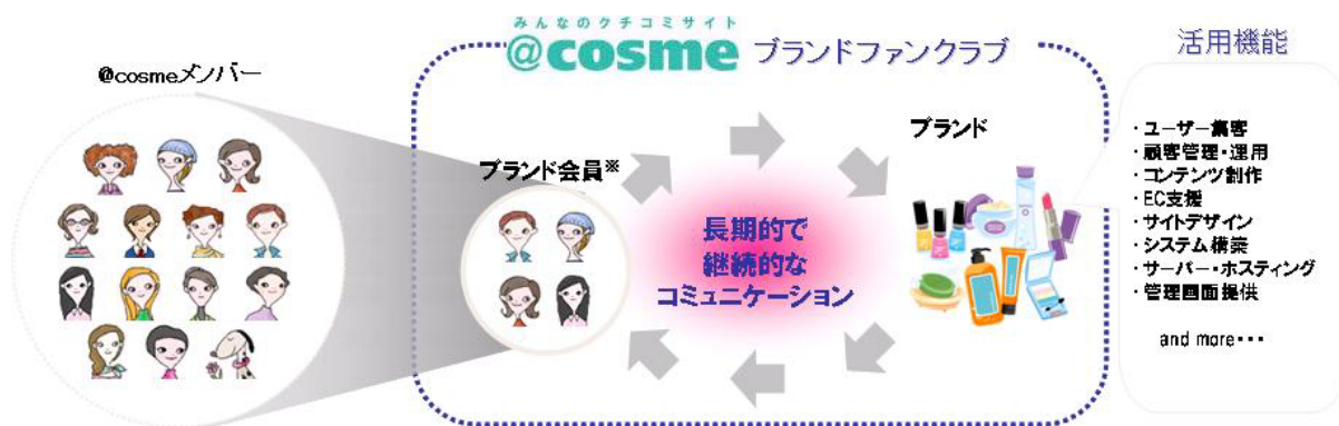
【ブランドファンクラブ サービス概要イメージ】

これにより、ユーザーはブランドからのお知らせやお得な情報を受け取ることができるとともに、欲しいと思った商品をその場ですぐに購入することが可能になります。