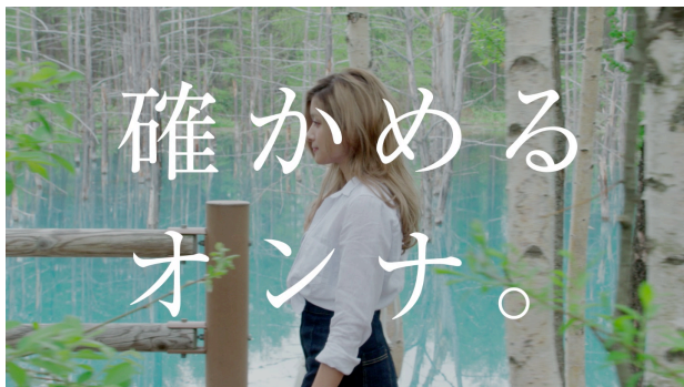
【CM カット「確かめるオンナ」篇】

今回撮影を行ったのは、観る目の覚めるような青が印象的な北海道美瑛町（びえいちょう）にある『青い池』。非日常的な池と、その畔にたたずむナチュラルなローラさんが織りなす美しいコントラストにも注目です。