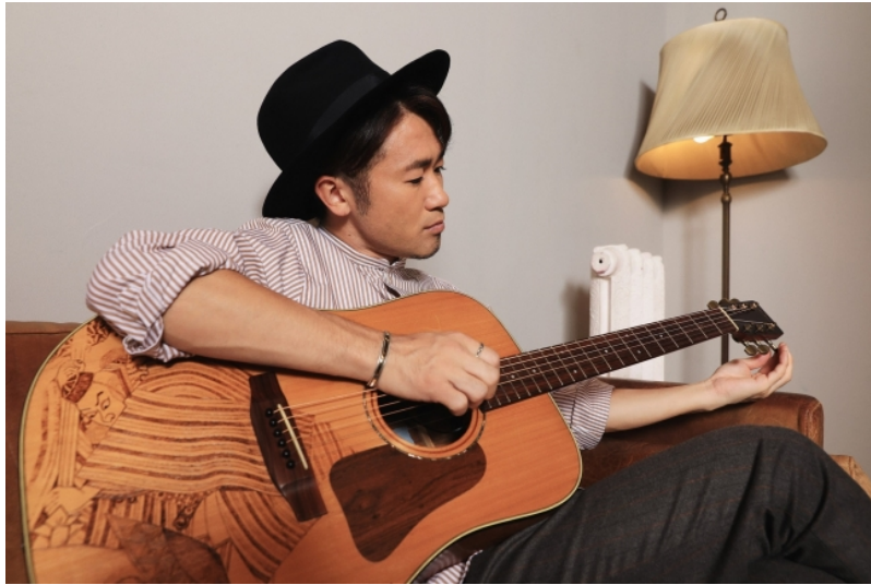
ナオト・インティライミ