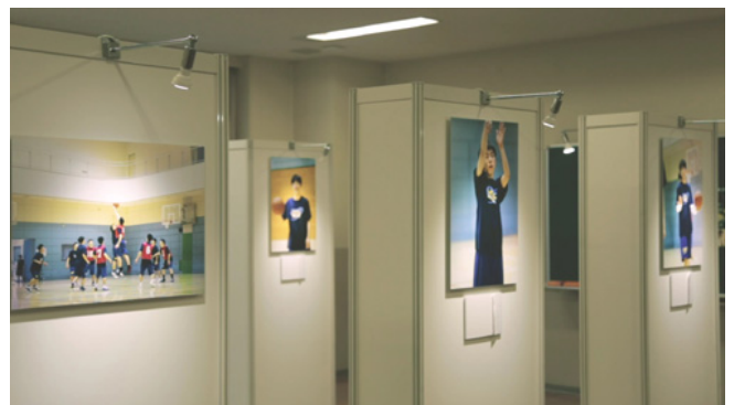
WEB 動画「小さな写真展」 動画シーン