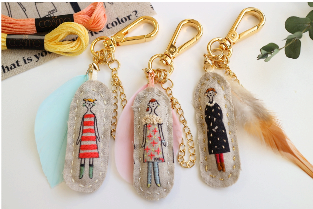
作品イメージ (完成)