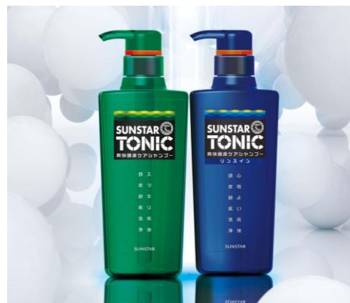
サンスタートニック爽快頭皮ケアシャンプー(左)

近年男性用シャンプー市場が注目されていますが、30代以上の男性の約4割がまだシャンプーを家族と兼用しているのが現状です*。男性は思春期から30代頃にかけて皮脂分泌量が増加し、同世代女性よりも多く分泌されます。そのため皮脂分泌量が多い男性は、皮脂をしっかり落とす洗浄力の高いシャンプーで頭皮クレンジングをすることが大切です。また男性が頭皮が脂っぼいと感じる年代は30代が最も多く*、皮脂でベタついて見える髪は不潔に感じるなど見た目の悪い印象を与える場合もあり、頭髮の悩みの一因にもなっています。サンスタートニックはベタツキやニオイの原因となる皮脂を除去する洗浄力の高いシャンプーで毎日洗髪する新習慣“オトコの頭皮クレンジング”をサポートします。*サンスター調べ