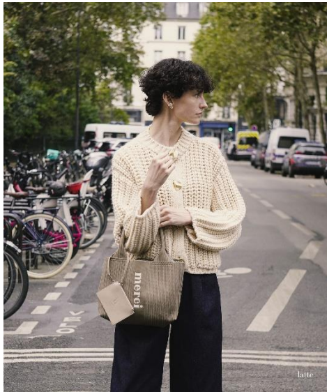
▲パリの街に溶け込むシックなカラー展開