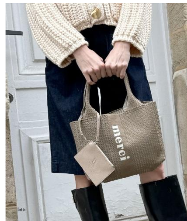
▲底板なしでもフォルムが崩れない