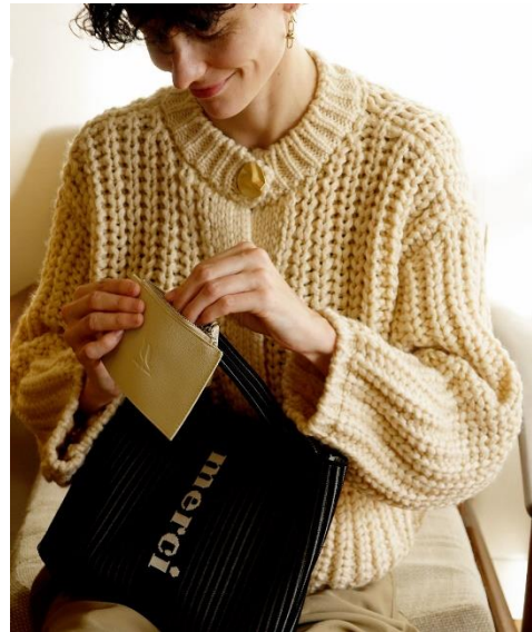
▲バッグにマッチするカラーの取り外し可能なポーチ付き