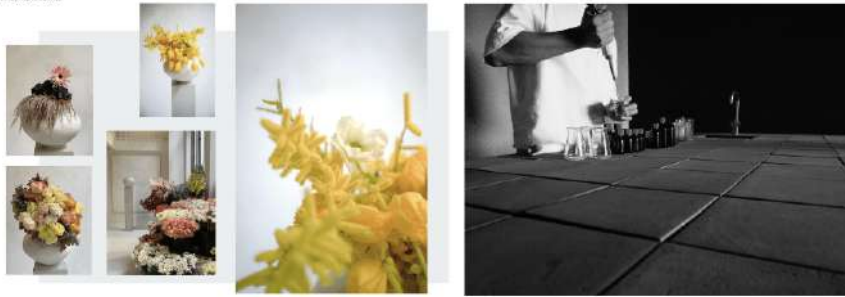
▲香りのイメージとなった花々や調香師による香水の調合工程