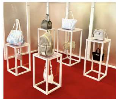
▲ポップアップ展示イメージ