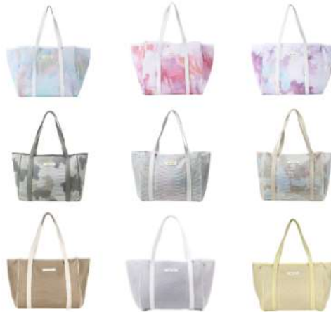
▲上段…nest n°1 l'arc(ネスト エヌワン ラルク)・中段…nest zip M l'arc(ネスト ジップ エム ラルク)・下段…nest zip M(ネスト ジップ エム)

q bag paris のバッグはパリからインスピレーションを受けた豊富なカラーラインナップが魅力のひとつ。1 コレクションあたり 20 色のカラー展開があるバッグもあり、普段は EC サイトでしか見られない彩り豊かなバッグを直接ご覧いただくことができます。