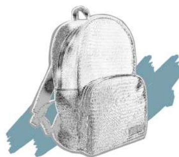
▲イメージ画像。新作ペアレンツバッグはポップアップ会場にて初お披露目いたします。(限定で先行発売、今後発売日は未定)