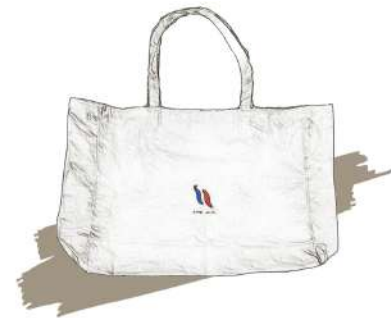
▲オリジナルバッグ(イメージ/300円にて販売)