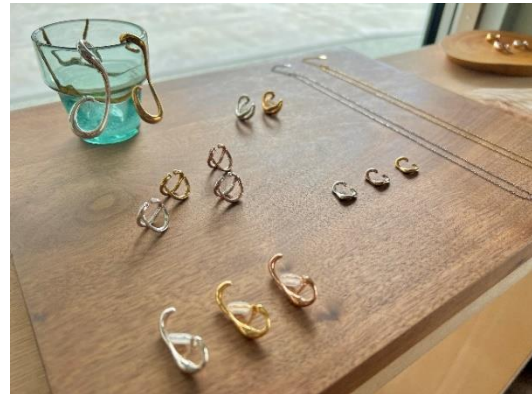
▲東京「aeru meguro」での展示の様子