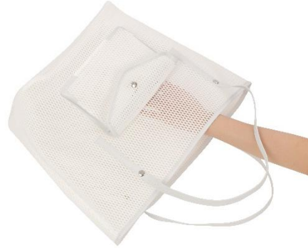
▲ネスト 20 素材