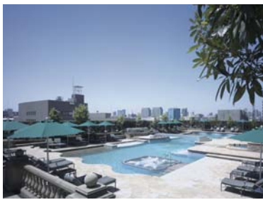
広々としたメインプール