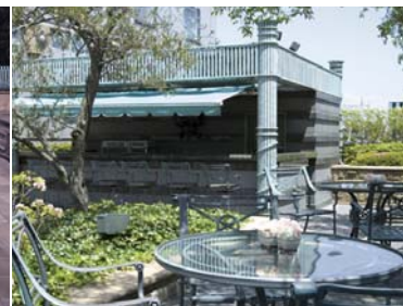
オリーブの木陰のガーデンカフェでは軽食やカクテルをご用意。