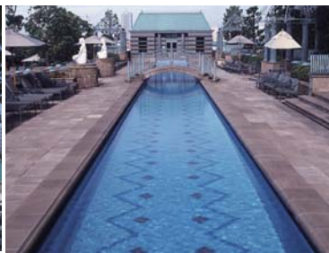
じっくり泳ぎたい方にぴったりのラッププール(48m)