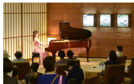
【ロビーコンサート開催風景】

音楽部門の中でも最も歴史のある「ホテルオークラ東京 ロビーコンサート25」は、ホテルオークラが開業25周年を迎えた1987年より毎月25日に開催しており、2018年3月で376回目となります。2011年4月からは、当ホテルの音楽活動にご賛同いただいている指揮者大友 直人氏に監修をお願いしております。