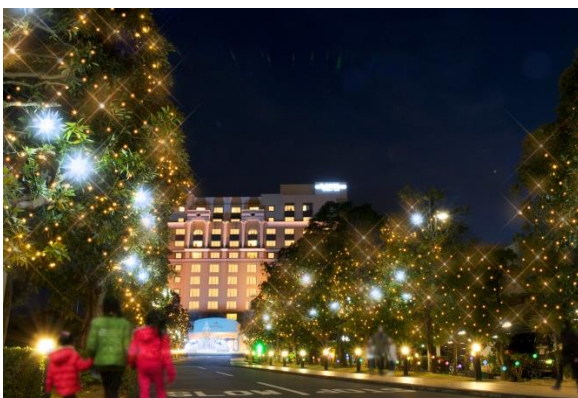
お客様を誘うような緩やかな光の演出

※2017・2018年度の点灯期間につきましても11月1日から翌年の2月28日までを予定しております。