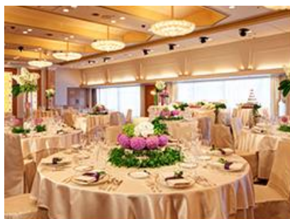
オーチャードルーム