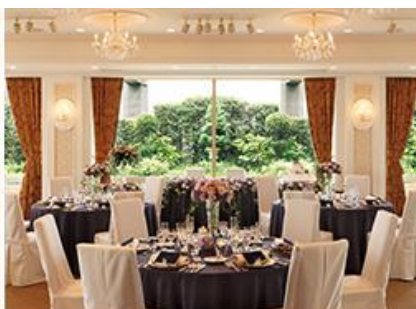
ケンジントンテラス

お料理・ケーキ・装花・写真など、ウェディングにかかせないアイテムを多数展示。実物をご覧くださいながらシェフやパティシエ、フラワーデザイナーなど専任のスタッフとご相談ください。