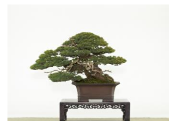
【第 88 回 国風賞受賞「五葉松」】