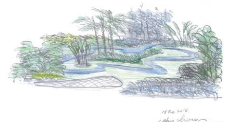
【ブラジル連邦共和国】

2014年に民主化20周年を迎えることを祝した、南アフリカ共和国ならではのカラフルなガーデンです。ナマクワランドのワイルドフラワーの草原の中に花が飾られてピアノが置かれています。