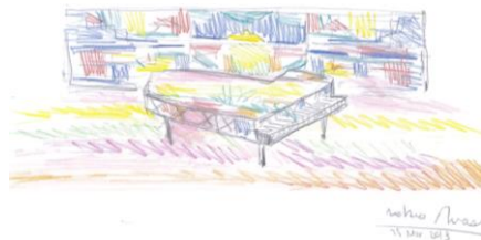
【南アフリカ共和国】

“オルト ジャルディーノ”はイタリアの家庭菜園です。ハーブや果樹で彩られたオーガニックな家庭菜園はとってもオシャレ。このイタリア式の家庭菜園を一足早くご紹介。