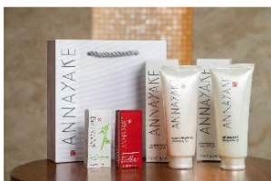
<ピュリファイ>セット