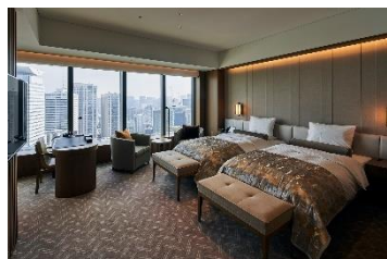
プレステージルーム