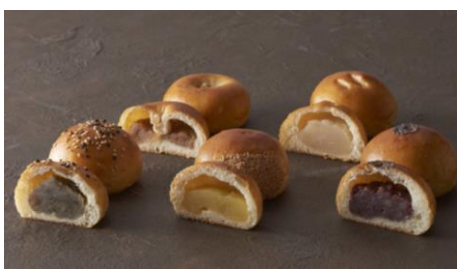
『虎のあん』5種セット (右下から時計回りに、粒あん、栗あん、 玉露あん、きな粉あん、柚子あん)