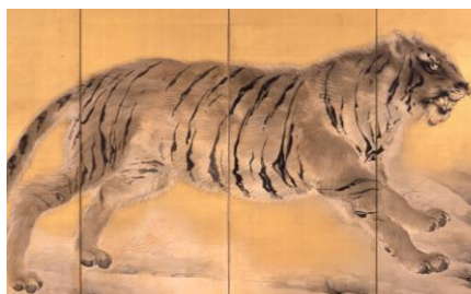
岸竹堂《猛虎図屏風》(部分) 千總