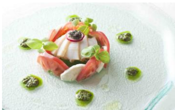
フランス料理イメージ