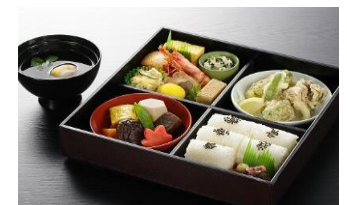
松花堂弁当イメージ

ご人数によって最適なスペースをご用意いたします。総料理長自らがプロデュースする特別メニューをお楽しみください。