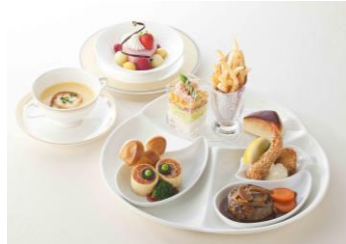
お子さまメニューイメージ