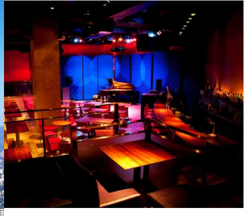
プランのお客さまはご優待料金でお楽しみいただける 「ニューイヤージャズライブ」。JZ Brat SOUND OF TOKYOにて。

■プラン期間：2016年12月31日（土）チェックイン～2017年1月2日（月・休）チェックアウトの2泊3日