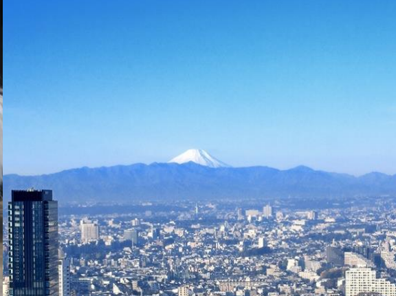
客室や40Fのレストランから望む富士山。その他 新宿副都心や東京の2大タワーなど美しい眺望が魅力です。