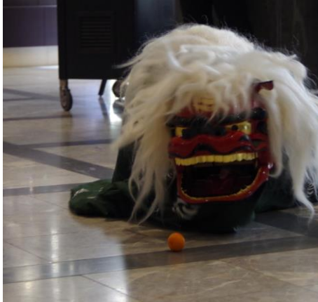
お正月にロビーやレストランを練り歩く「獅子舞」。 このほかにも様々なお正月イベントを館内で開催。