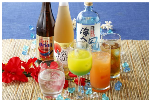
沖縄フリードリンク一例