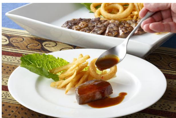
ビーフステーキ取り分けイメージ

沖縄をテーマにしたフェアは昨年夏にも開催し、ご好評をいただいております。今年はメインディッシュにビーフステーキを加え、味はもちろんボリュームもご満足いただけるプランにパワーアップして期間限定で販売いたします。島らっきょうなど現地で定番の食材を使った4種の前菜は盛り合わせにしてお1人様ずつに。沖縄料理の中でも人気が高いゴーヤチャンプルやビーフステーキは、お仲間とワイワイ取り分けていただける大皿盛りで提供いたします。締めには鰹のだしが香るラフテーそばをご用意いたしますので、最後のひと口まで沖縄の味覚をご堪能いただけます。フリードリンクメニューはオリオンビールをはじめ、泡盛、シークワサーサワー、沖縄ビアなど沖縄にちなんだものと、エビス生ビール、ワイン、ハイボールなど通常のアイテムも充実しております。夏のアフターファイブは渋谷駅前ホテルのレストランで、しばし南国気分を味わってみてはいかがでしょうか。