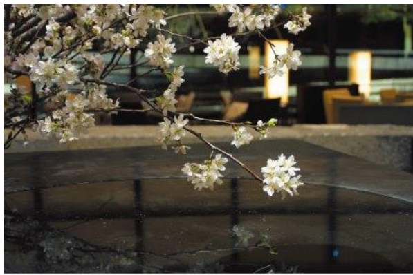
【ホテル内ロビーいけばな～さくら】