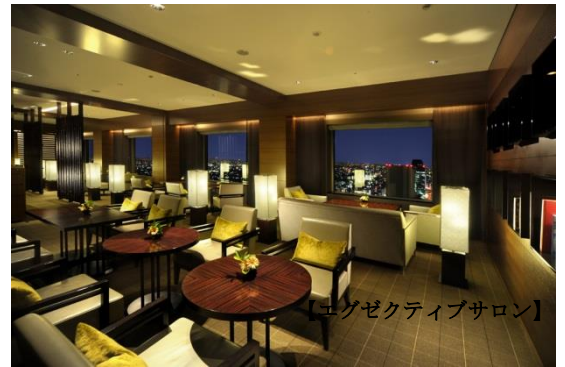
【エグゼクティブサロン】