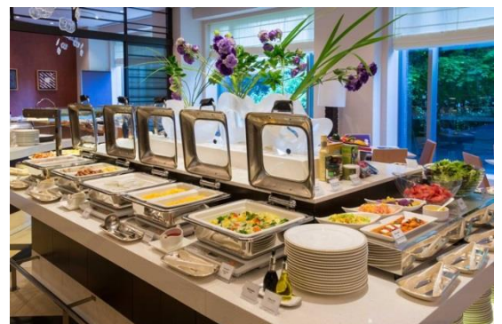
【「かるめら」朝食イメージ】