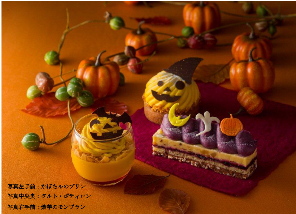
写真左手前：かぼちゃのプリン 写真中央奥：タルト・ポテリオン 写真右手前：紫芋のモンブラン