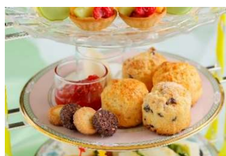
<中段：バイクドスイーツプレート> ・プレーンスコーン ・メロンパン風スコーン ・クロテッドクリーム&ジャム ・ダイヤモンドクッキー (ヘーゼルナッツ&アーモンド)