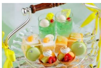
<上段：スイーツプレート> ・メロンソーダ ・メロンのショートケーキ ・赤メロンのムース ・メロンのタルト ・メロンのマカロン

一緒に楽しむ飲み物は、グレープフルーツの果実味とジャスミンの香り広がるオリジナルデザートドリンク「茉莉花」に加え、14種の茶葉やコーヒーからお好きなアイテムを1つお選びいただくことができます。