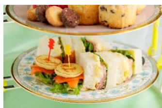
<下段：オードブルプレート> ・ペッパーハムと玉子サラダのサンド ・トラウトサーモンのプリニサンド