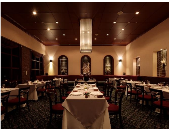
※レストラン「シャモニー」

e メール： h.hagiwara@tokyuhotels.co.jp / a.date@tokyuhotels.co.jp