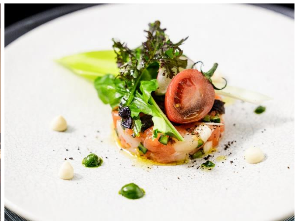
※お料理イメージ（仕入れや季節によりメニューが変わります）