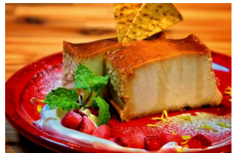
スイーツイメージ

テラスにあるパーラーでは、10時から22時まで、気分 の上がるドリンクや軽食を提供します。18時からのナイト タイムには、一日を締めくくるドリンクと一緒に、スペシ ャルな夜スイーツをご用意しますので、波の音や風を感じなが ら、出会いと語らいを愉しむひとときをお過ごしください。