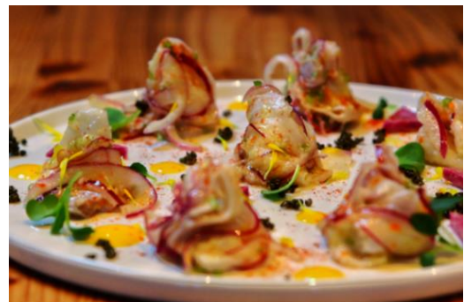
イマイユのセビチェ（県産鮮魚のマリネ）