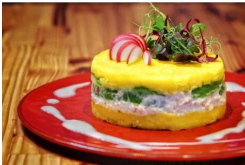
カウサ・レジェーナ（ペルー風ポテトサラダ）