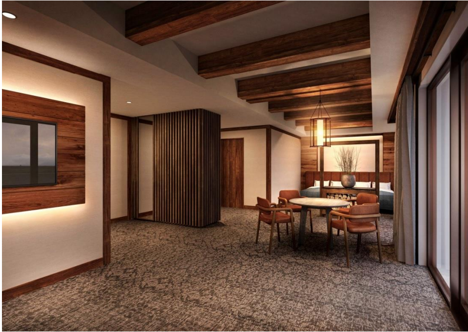
アルブル (Arbre) 詳細 https://www.tokyuhotels.co.jp/hakuba-h/room/111985/index.html