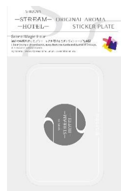
アロマプレートイメージ