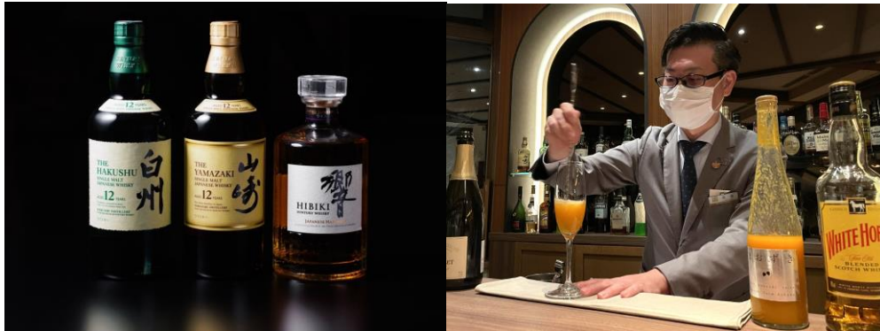
(左) 世界でも大人気のジャパニーズウイスキー (右) 白馬産ほおずきを使ったオリジナルカクテル

世界で人気が高まっているジャパニーズウイスキーを揃え、期間限定のおすすめドリンクに白馬産ほおずきを使ったカクテルや、こちらも近年人気が高まっている信州ワインなど、地元のものを並べました。