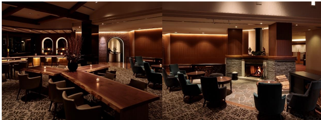
お食事用のダイニングスペース、バースペース、暖炉のあるリビングスペースがある「ザ・ロッジ」