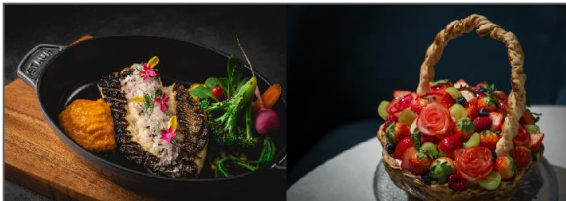
(左から) ソイのグリル ナッツと野菜のピュレ、苫小牧市 苫東ファームの苺「よつぼし」のシグネチャーパフェ

「BAR & GRILL Splish」は、宿泊のお客さまはもちろん、地元の方の普段使いから特別なひとときまで、さまざまなシーンでお使いいただけるメニューで皆さまをお迎えいたします。食を通して喜びと驚きに満ちた新しい体験をご提供することを目指し、チャレンジを続けてまいります。すすきのに誕生した新たなグルメスポットで、新しい食体験をお楽しみください。