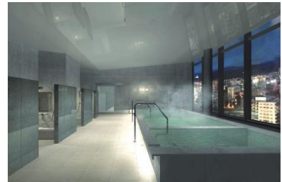
札幌の夜景もご覧いただける温浴施設イメージ （プレミアムカテゴリーご利用特典）

東急ホテルズにおける新たなライフスタイルホテルブランドとなる「STREAM HOTEL」は、2024 年 1 月 16 日の SAPPORO STREAM HOTEL の開業に合わせて、同日「渋谷ストリームエクセルホテル東急」を「SHIBUYA STREAM HOTEL」にリブランドし、本ブランドのフラッグシップホテルとして位置付けます。「STREAM HOTEL」は、渋谷と札幌の 2 拠点から展開をスタートいたします。