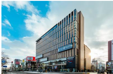
SAPPORO STREAM HOTEL 外観