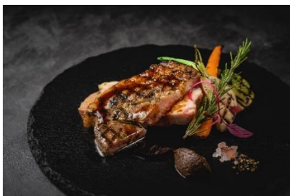
ディナーイメージ