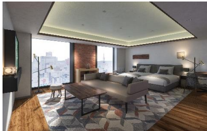
プレミアムコンフォートツイン