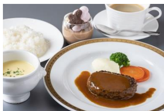
羽田エクセルホテル東急の昼食

また、本コースのお楽しみとして、ご参加の方から抽選で1組2名様に、「羽田エクセルホテル東急『シェフおすすめディナーフルコース』」をプレゼントいたします。