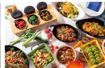
川崎キングスカイフロント東急 REI ホテルの夕食

羽田空港周辺と京浜臨海部は、2022年3月に開通した多摩川スカイブリッジで結ばれ、アクセスが非常に良くなりました。今後もエリア一帯の魅力を発信できるよう、各社と連携した企画を検討してまいります。