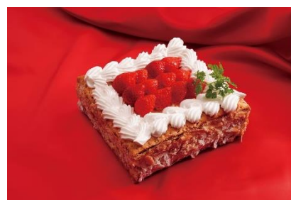
いちごミルフィーユ