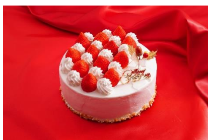
いちごショートケーキ