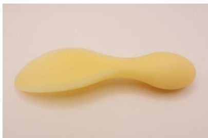
アップサイクルした靴べら

ご予約はこちらから： https://www.tokyuhotels.co.jp/esaka-r/stay/plan/