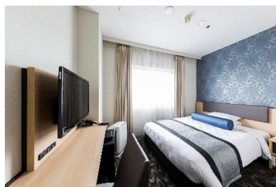
スーペリアシングル

東急ホテルズ&リゾートは、ホテル事業を通じて「持続可能な社会」の実現に貢献するべく、2019年に【サステナブル方針】を制定し、「地球にやさしいホテル・まちにやさしいホテル・ひとにやさしいホテル」という3つのサステナビリティ（目指す姿）と6つのサステナブル重要テーマ（社会課題の中から重点的に取り組んでいくテーマ）を定め、SDGs（持続可能な開発目標）の観点を深く認識しながら、ホテル事業を通じて「持続可能な社会」の実現に貢献してまいります。