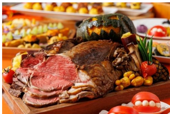
▲料理長自慢のローストビーフ