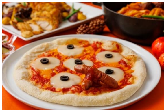
▲指ソーセージ&ピザカプリチョーザ