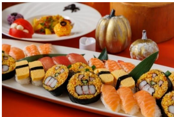
▲ジャック・オー・ランタンのお寿司