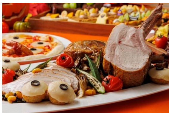
▲目玉お化けのコロッケと骨付き豚のロースト