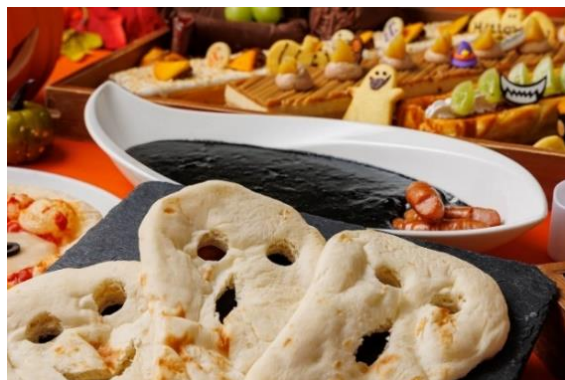
▲竹炭ブラックビーフカレーとナン