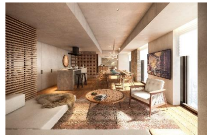
プレミアム スイート

最上階の18階には、プレミアムタイプに滞在するお客様が無料で利用できるラウンジの他、サウナ付温浴施設、ルーフトップテラスを備え、朝・昼・夜、それぞれに札幌の眺望を楽しみつつ、特別なひとときをお過ごしいただけます。