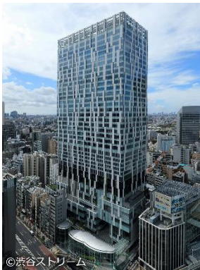
渋谷ストリーム 外観