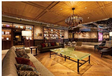
渋谷ストリームエクセルホテル東急 ロビー