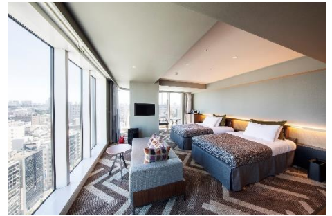
客室 スーペリアコーナーツイン