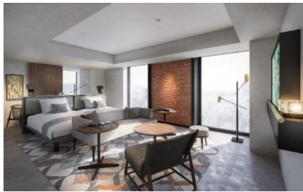
スーパーリアプラス コーナーツイン