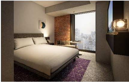
スーパーリア ダブル

客室タイプはスーパーリア、スーパーリアプラス、プレミアムの3カテゴリ、全436室。内装はスタイリッシュなデザインのほかにも北海道・札幌の自然・文化・歴史等が感じられるインテリアや照明演出、空間デザインを取り入れます。