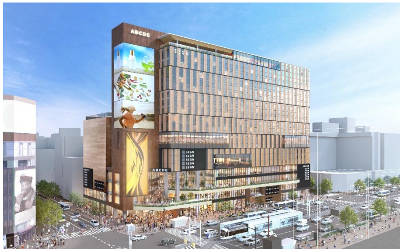
SAPPORO STREAM HOTEL 外観イメージ