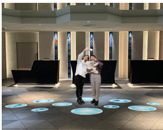
1F グランドフロアフォトスポットイメージ

【場 所】1F グランドフロア、2F ロビーフロア、3F UMIKAZE TERRACE (海風テラス)