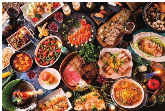
ディナーbuffetイメージ