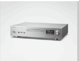
ネットワーク/SACDプレーヤー SL-G700