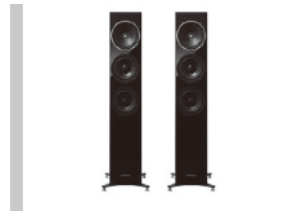
スピーカーシステム SB-G90