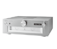
プリメインアンプ SU-G700