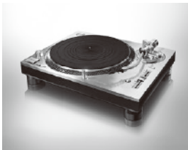
レコードプレーヤー SL-1200G