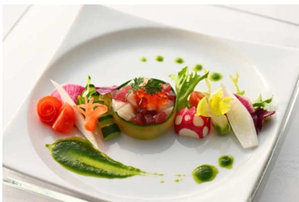
ハレの日に相応しいお祝い料理