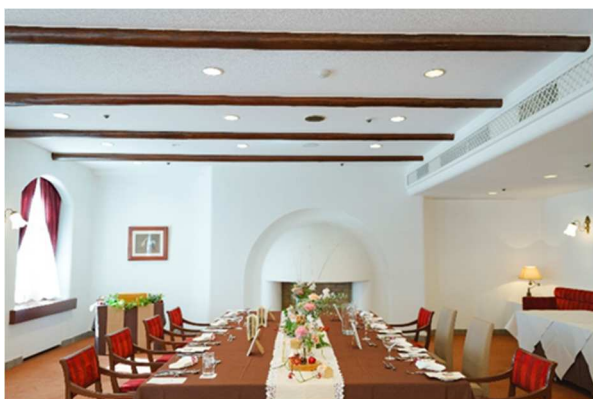
プライベート空間を感じるレストラン「からまつ」

曲線美の優しい雰囲気とアンティークな装飾で中世ヨーロッパの午餐を彷彿させるレストラン「からまつ」では、「信州食材を使用した料理をゲストにプレゼントしたい」という声が多く寄せられるため、プランナーがシェフに直接相談して生み出された新メニューをご用意。信州サーモン・信州プレミアム牛フィレ肉・信州リンゴなどの地元の食材と、卓越したプロの技術が織りなす自慢の逸品がハレの日を美しく飾ります。おふたりの結婚式だけのオリジナルメニューも相談可能。シェフと直接お話しいただく打ち合わせの際、おふたりのご希望をお聞かせください。