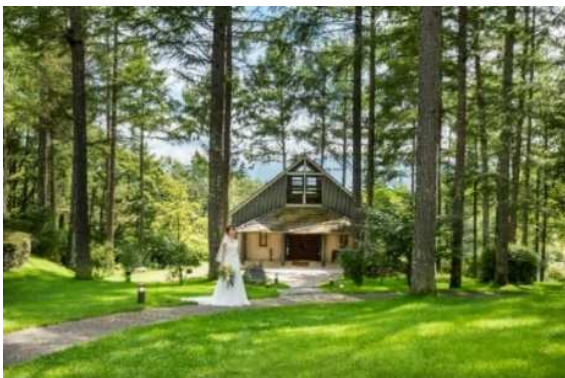
自然に溶け込むチャペル（外観）