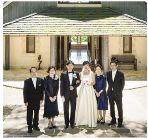
当日の撮影時間はたっぷり。挙式後はご家族との撮影も