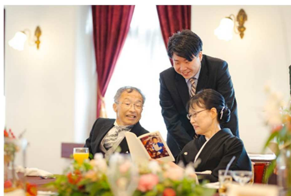
思い出話に花を咲かせて