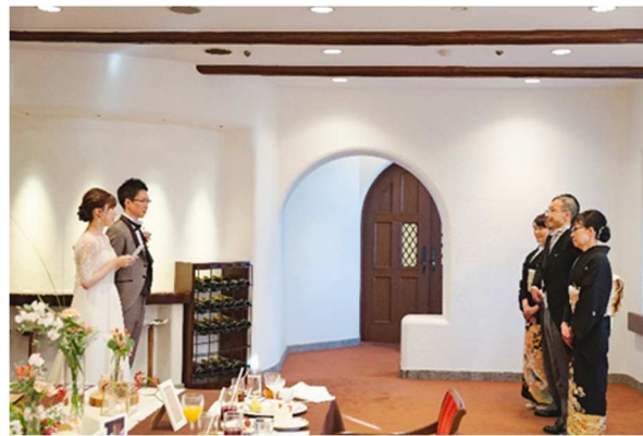
結婚式でしか伝えられない、感謝の気持ちを