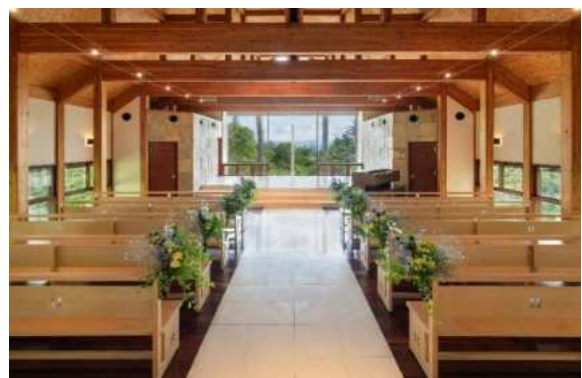
窓から差し込む太陽光と木の温かみを感じるチャペル内観