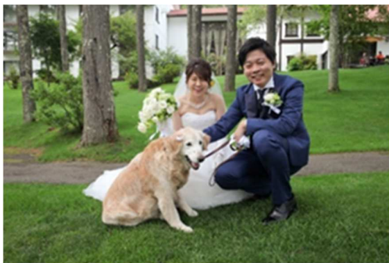
ペットと一緒にロケーションフォト