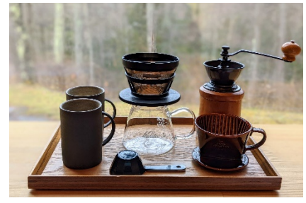
サステナブルなコーヒーミルセット