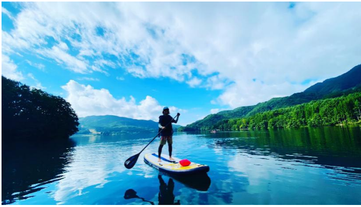
早朝 SUP レンタル イメージ