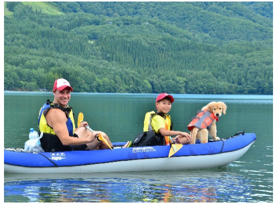
青木湖アクティビティ イメージ