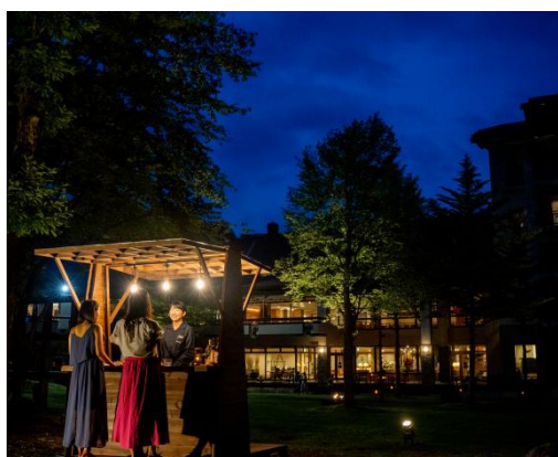
バーカウンター イメージ