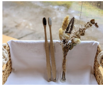
サステナブルセレクトのアメニティ