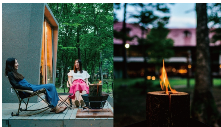
TENAR デッキと焚き火イメージ