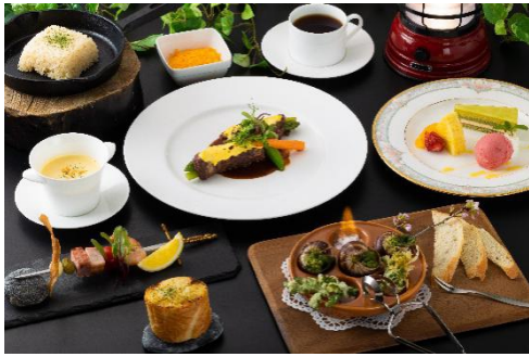
「TENAR リトリート」プラン限定ディナー