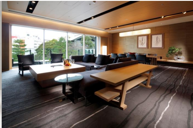
特別イベントを開催する「山王スイート」