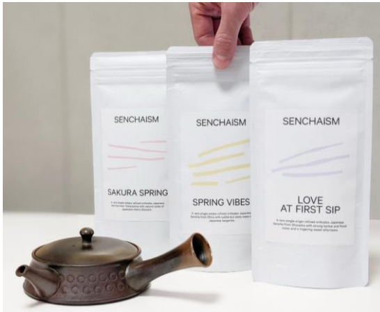
オスカル氏セレクトの日本茶「SENCHAISM」