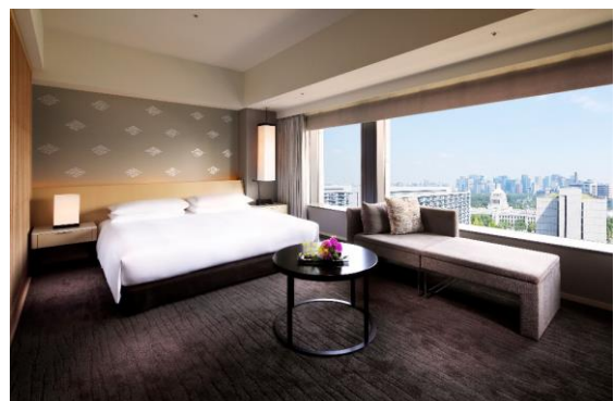
デラックス キング

そのオスカル氏が年に一度の新茶の季節に厳選した茶葉を使用し自らが淹れる極上の日本茶に、国内外の賓客をもてなし続けてきた安里が1日限りの甘美なスイーツをマリアージュ。ホテルならではの特別な時間を通じて日本人でも目からうろこの稀少な日本茶とスイーツの饗演を是非この機会にご堪能ください。