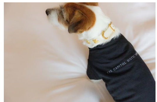
ザ・キャピトルホテル 東急 ロゴ入りオリジナル T シャツ

「ドッグフレンドリー宿泊プラン」は販売当初から、愛犬と一緒にベッドで就寝していただけることや、記念写真の演出にもご活用いただけるホテルロゴ入りオリジナル T シャツのプレゼント、ペット入店可能な近隣の飲食店を記したコンシェルジュ特製お散歩マップのご用意など、日々サービスとアイテムを充実させてまいりました。お客さまのご期待やご要望、そしてホテルならではの“おもてなし”を掛け合わせて成長してきた本プランは、今後も引き続き新たなサービスを求めてドッグフレンドリーステイの満足度を高めてまいります。