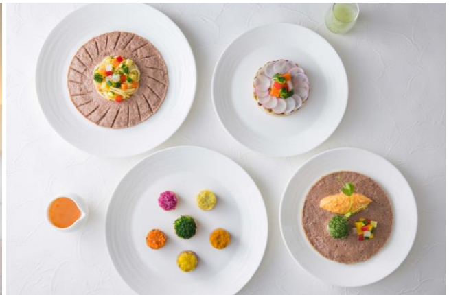
愛犬のルームサービスディナー&ブレイクファースト

ザ・キャピトルホテル 東急(東京都千代田区永田町、総支配人:末吉 孝弘)では、現在販売している「ドッグフレンドリー宿泊プラン」の同伴犬数を“最大 2 匹から最大 3 匹”へ拡張。さらに 2022 年 3 月 23 日(水)より日本アニマルウェルネス協会認定のペットフードイストが監修した「愛犬のルームサービスブレイクファースト」(※)の提供を開始し、ご夕食とご朝食の両方を取り揃え、愛犬とより長くお部屋でお過ごしいただけるようにいたしました。(※ご夕食は既に「愛犬のルームサービスディナー」として提供中)