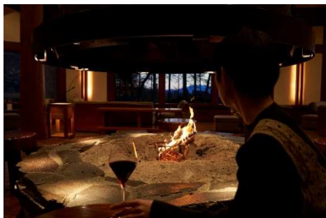
ゆったりとした時を過ごす