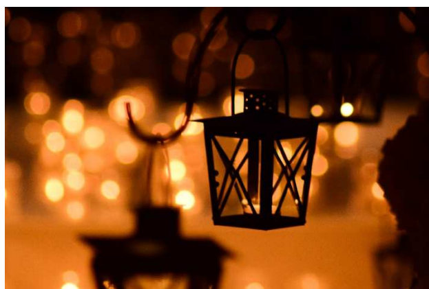
“映え”スポットをチェック