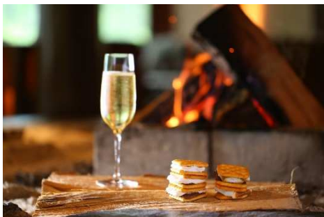
暖炉で愉しむ焼きマシュマロ

期間中、蓼科東急ホテル内のロビーラウンジ「アゼリア」では、スモアの無料体験を開催します。暖炉で焼いて柔らかくなったマシュマロとチョコレートを、全粒粉のクラッカーで挟んでお召し上がりいただきます。パートナーやご家族と甘く心温まるひとときをお過ごしください。