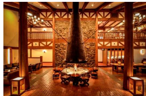
館内中央にある暖炉