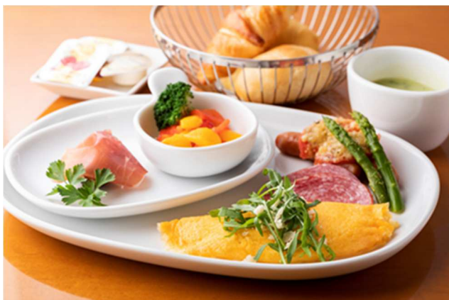
●和・洋チョイスできる朝食

滞在中、ホテル内レストランにてご利用いただける、和洋チョイス可能なプレートスタイルのご朝食を、7回分無料でご用意いたします。また、ゆっくりしたい朝には、ホテル内ラウンジにてのランチや、お部屋でゆっくり過ごせるテイクアウトのサンドウィッチへの変更も可能です。その日のご予定に合わせ、ご希望のお食事スタイルをお選びください。