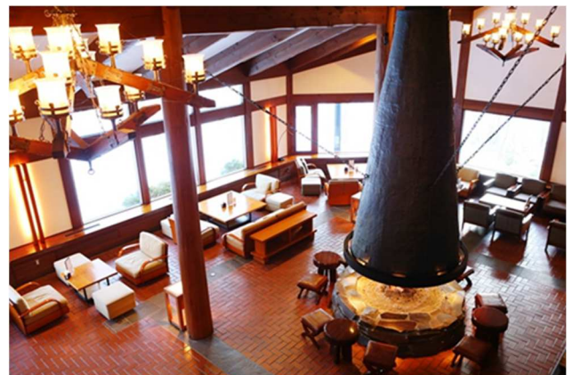
●あたたかな暖炉を囲ってのランチもおすすめ