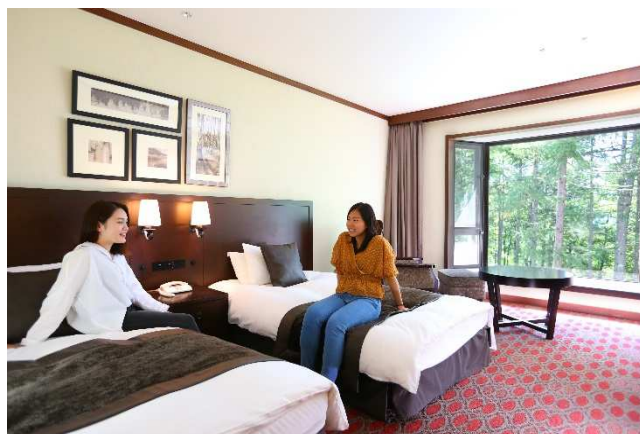
●ガーデンを眺めながらゆったりとした時を過ごす