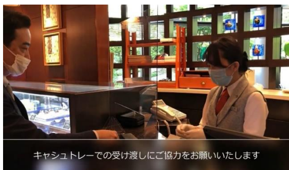
キャシュトレーでの受け渡しにご協力をお願いいたします