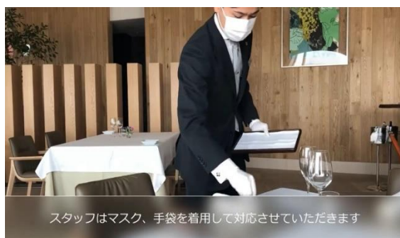
スタッフはマスク、手袋を着用して対応させていただきます