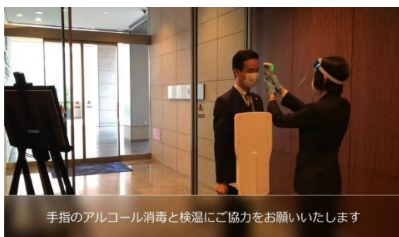
手指のアルコール消毒と検温にご協力をお願いいたします

https://www.tokyuhotels.co.jp/cerulean-h/information/60471/index.html