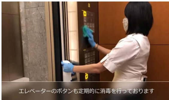
エレベーターのボタンも定期的に消毒を行っております