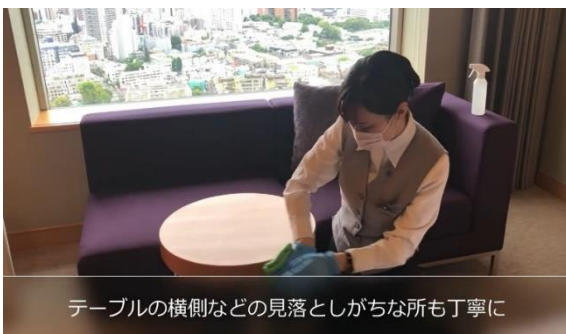
テーブルの横側などの見落としがちな所も丁寧に