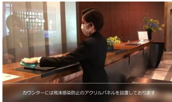
カウンターには飛沫感染防止のアクリルパネルを設置しております