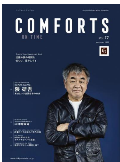
ON TIME 表紙