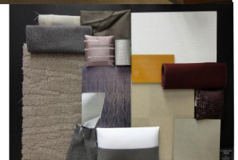
【カラースキーム (さくら)】