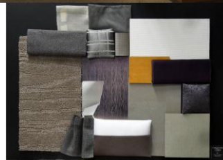
【カラースキーム (利休)】