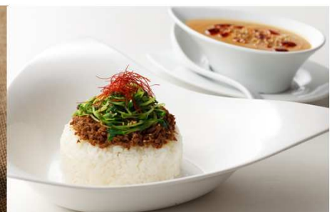
坦々カレー 9月16日～9月30日