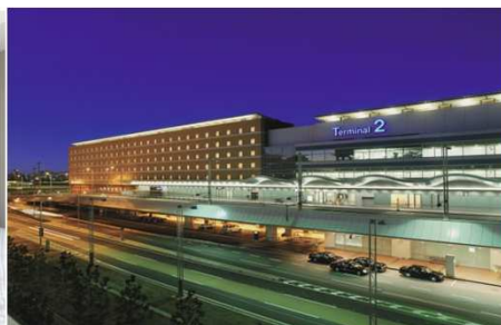
ターミナル直結の利便性