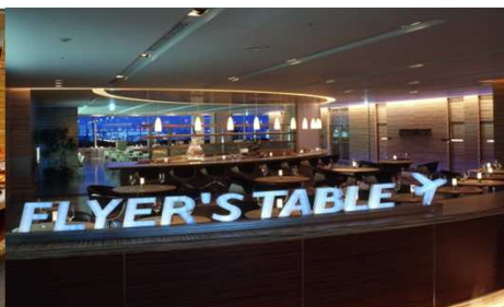
深夜25:00まで営業のレストラン