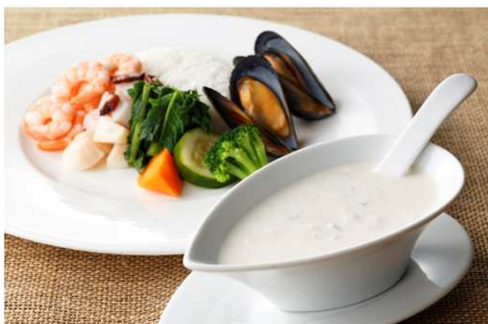
シーフードのホワイトカレー 7月1日～7月15日