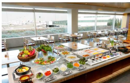
早朝5時からオープン朝食ブッフェ