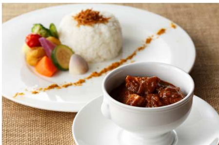
豚バラ肉のスパイシーなマドラスカレー 8月16日～8月31日