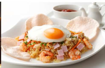
プランメニュー「ナシゴレン」イメージ