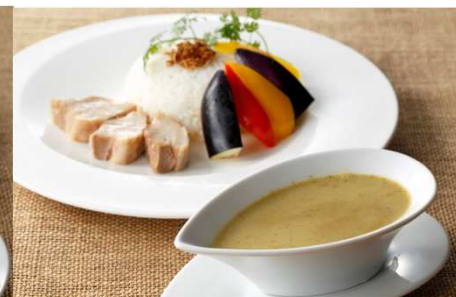
豚肩ロース肉と野菜のグリーンカレー 9月1日～9月15日