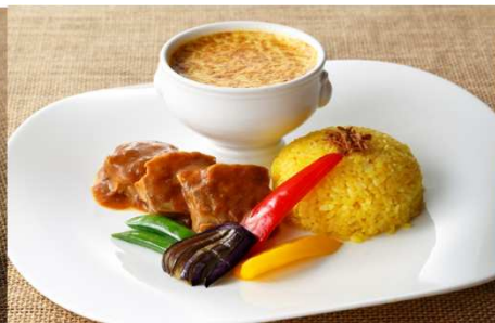
玉ねぎ入りグラタン風カレー 7月16日～7月31日