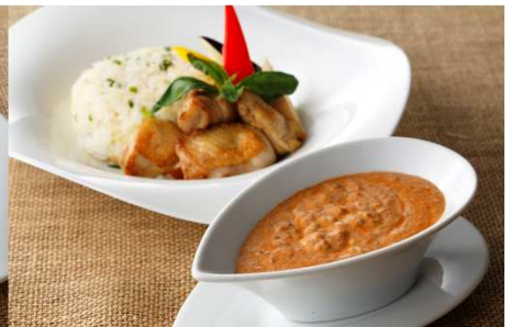
牛挽肉のレッドカレー 柚子胡椒風味チキン添え 8月1日～8月15日