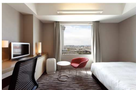
スーペリアシングル