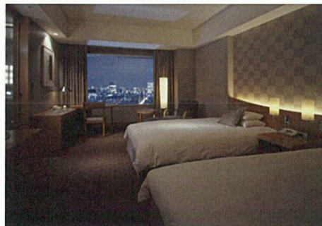
デラックスツインルーム