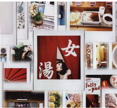
まつゆう*「CAMERA TO TRAVEL」